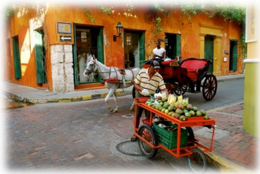
El pueblo de Colombia

¿Lo solucionarán los grupos de personas que ves debajo? Pensemos qué puede hacer y qué no puede hacer cada uno de ellos.