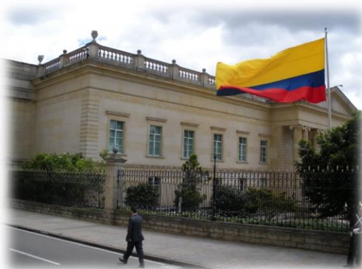
El gobierno de Colombia